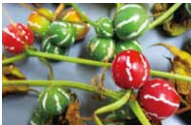
オキナワスズメウリの実

カラスウリの花は、名前とは反対に真っ白で大きく、花弁の淵がレース状になった花を咲かせる。ネットでその花を知り、是非見てみたいと思った。南部でカラスウリを見たことはないが、やんばるの山道で実を見たことがあったので早速取ってきて種を庭に植えた。夜しか咲かないので、花を咲かせたときは電灯に輝くレースの花にドキドキしたものである。因みにカラスウリの花言葉は「男嫌い」。命を産み育てる女性とは逆に、新基地を建設して戦争へと突き進むことに躊躇しない男はその地に咲く花にも嫌われているようだ。