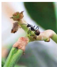
マメの番をする蟻