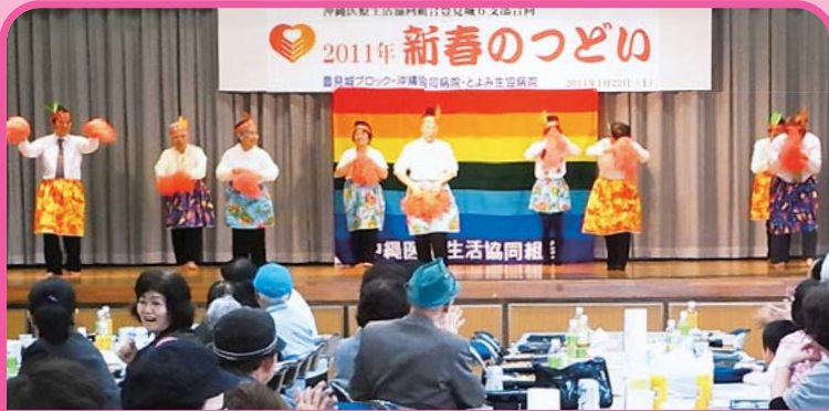
1月22日 豊見城6支部合同 長嶺支部による楽しいハメハメハ