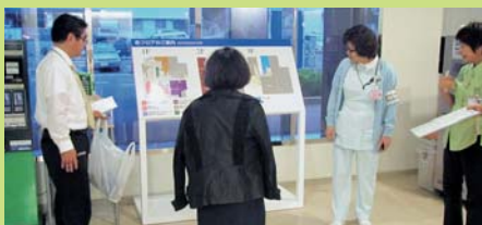
わかりやすくなった外来案内板