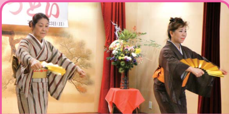
1月23日 小禄3支部合同 組合員によるすばらしい幕開け