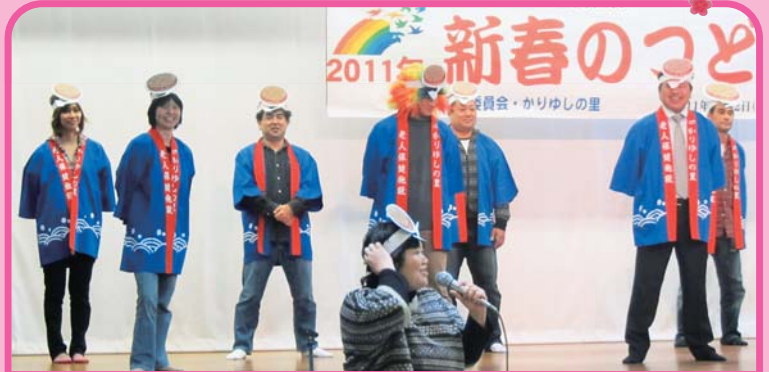
1月22日 南部合同 頭にお好み焼きをのせて、てっぱんダンス始めるよー。