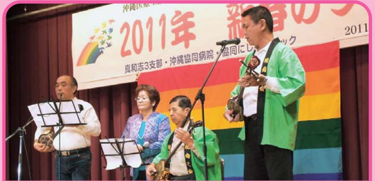
1月23日 真和志3支部合同 息の合った民謡ショー