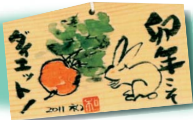
画：内科医 上原和博